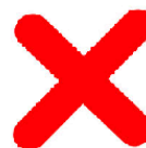
Figura: Ejemplo de votos en elecciones Sociedad Chilena de la Criósfera. Izquierda: Válidamente emitido, marcando 3 preferencias. Derecho: NULO por marcar más de 3 preferencias.

Candidat@ 1 _____+ Candidat@ 2 _____ Candidat@ 3 _____+ Candidat@ 4 _____ Candidat@ 5 _____+ Candidat@ 6 _____+